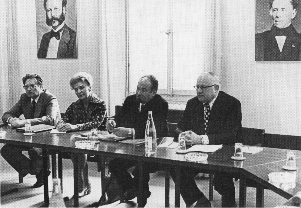
Ginebra: El presidente y una delegación de la Alianza de Sociedades de la Cruz Roja y de la Media Luna Roja de la URSS visitan la sede del CICR.