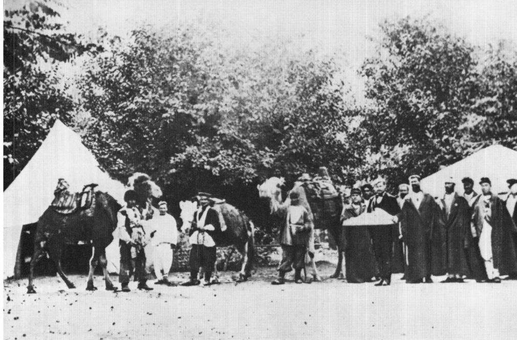
1877 — Hospital de campaña de la Cruz Roja Finlandesa durante la guerra ruso-turca, en Eriwan (Cáucaso).